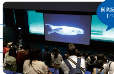
開業記念特別レクチャー 「ペルーガの繁殖」