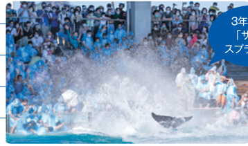
3年ぶりの 「サマー スプラッシュ」