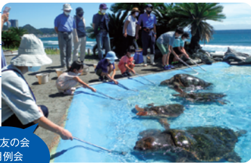
動物友の会 9月例会 「は虫類」