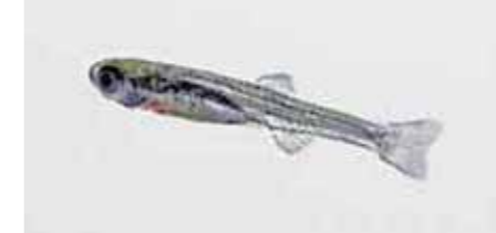
▲ 二枚貝から浮上した稚魚(体長9mm)