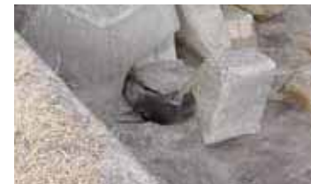
▲ 砂浜で横たわるキタオツセイ (いすみ市:2月22日)