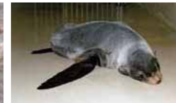
▲ 搬入後のキタオツセイ