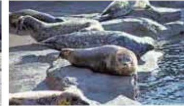
▲ 自分の昼寝場所も決まりました