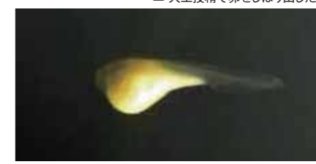
▲ 人工授精でふ化した仔魚(5日齢)