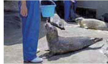
▲ 他のアザラシと一緒に食事の時間