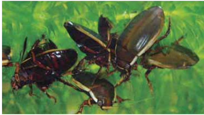
▲ シャープゲンゴロウモドキ