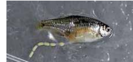
▲ 人工授精で卵をしほり出した雌

を開始し、2014年から2016年の3年間で約1,000個体を確保しました。2015年から人工授精も行い、2015年は5個体、2016年は37個体を確保することができました。今後、人工授精による繁殖技術の発展と産卵母貝となる二枚貝類の飼育繁殖の確立をめざしています。