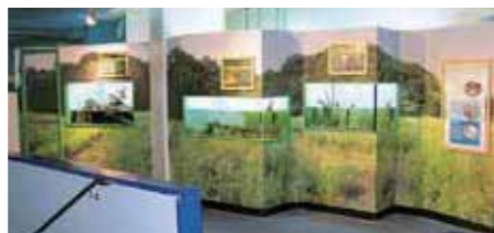
▲ 「生物多様性コーナー」

当館では、2014年4月にエコアクアローム内に「生物多様性コーナー」を設置し、千葉県に生息する希少生物を展示し、