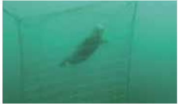
▲ 定置網に由来したゼニガタアザラシ