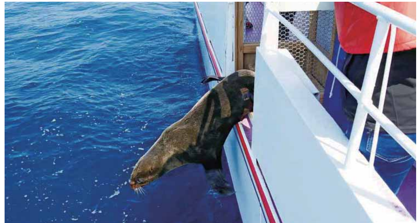
▲ 放流の瞬間 (茨城県鹿島沖:3月30日)