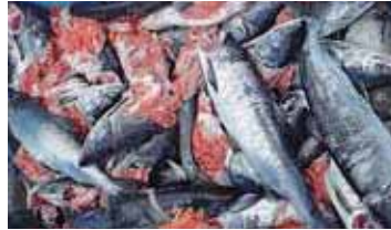
▲ 食い荒らされたサケ