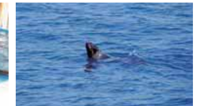
▲ 船のまわりを泳ぐキタオツセイ (茨城県鹿島沖:3月30日)