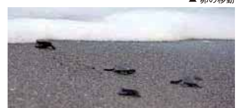
▲ 海に放立つ子ガメ

鴨川シーワールドでは、自然豊かな千葉県に生息する希少生物をご覧いただき、地域の生物多様性の重要性を伝える普及啓発にも役立てていきたいと考えています。