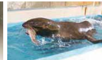
▲ エサを食べている様子