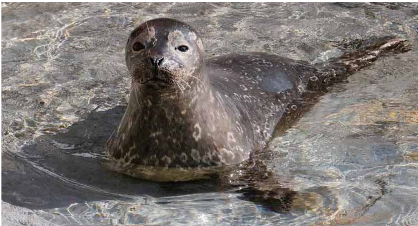
▲ 仲間入りしたゼニガタアザラシ「ハク」