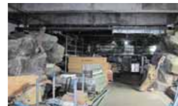
▲ 工事中のエコアクアローム