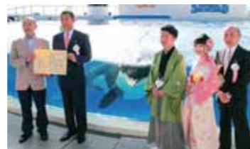
▲ 鴨川市長より「成人証書」を授与された「ラビー」