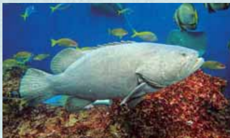
吉村 智範 Tomonori Yoshimura

体長1.6mの大きなタマカイを沖縄より輸送し2月1日に展示しました。魚類輸送専用の大型トラックを使い、那覇から東京までは、貨物船に大型トラックを乗せ、輸送には合計53時間を要しました。海水をくみ上げ、入れかえをしながら輸送をしましたが、北上につれて水温が下がってしまうため、3~4時間ごとに水温や水質を測定しながらの輸送となりました。到着後の移動作業でも、これまであつかったことのない大きさであるため、事故を起こさないように、8人がかりでトロピカルアイランドの「無限の海」へ収容しました。