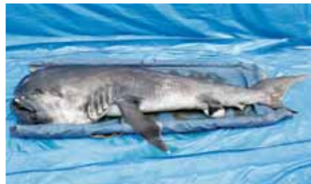
▲ メガマウスザメの全身(解凍後)