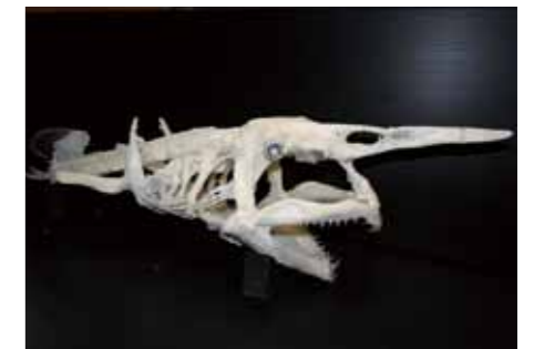
▲ 試作したミツクリザメの骨格標本

現在、標本作製作業は進行中ですが、完成した際には世界初となる全身骨格標本として展示する予定です。ぜひご期待ください。