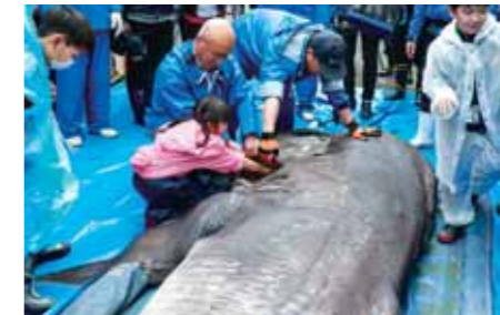
▲ エラの中に手を入れる