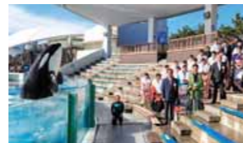
▲ 「ラビー」との記念写真