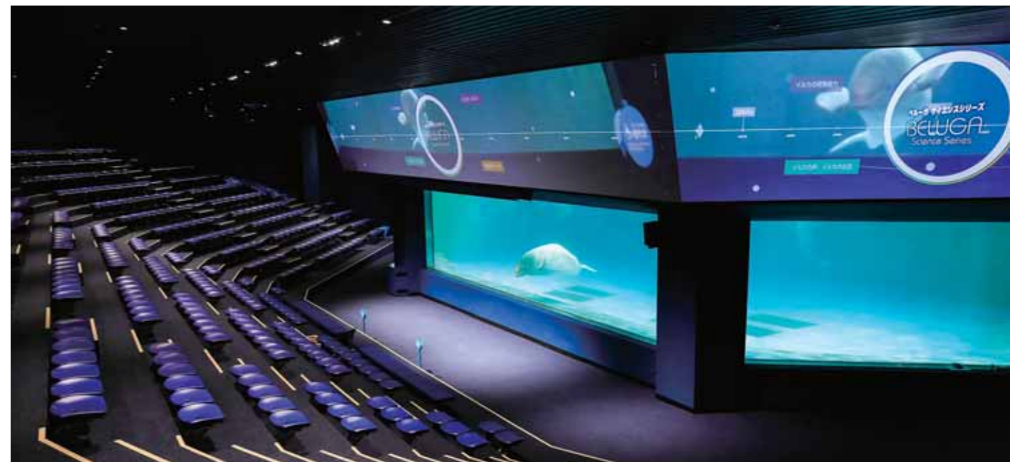
▲ リニューアルしたマリンシアター