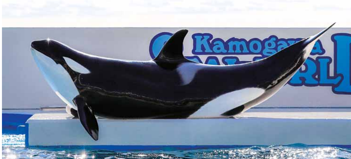
▲ 20歳になった「ラビー」