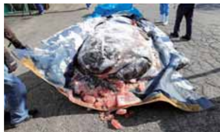
▲ 冷凍メガマウスザメ

協関係者の協力をいただき鴨川市内の大型冷凍庫まで運搬しました。冷凍保管中に表面の乾燥が進むと組織が傷んでしまうため、定期的に水をかけて氷の膜を作り、乾燥を防ぎました。そしてこの間、過去にメガマウスザメの解剖と標本作製の経験を持つ水族館から情報収集をおこなって検討した