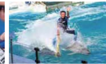
▲ イルカの「ローマンライド」