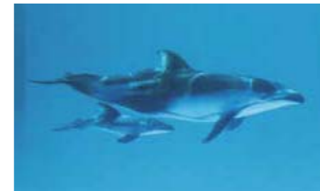
▲ 母親「ティアナ」(上)と「ティア」(下)