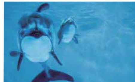
▲ 母親の「スピカ」(左)、「キララ」(右)

をくずしてしまいました。バンドウイルカでの経験を参考に、生後5～6カ月でエサを食べ始めるものと想定して、この頃から母親の給餌にあわせて餌付けを試みていましたが、カマイルカの場合はもっと早期の餌付けが必要だったのです。すぐに栄養補給のための処置が開始されることになりました。毎日2回、カテーテルを食道から胃まで通して魚のすり身を流し込むほか、のどの奥に魚を押し込んでのみ込ませる「強制給餌」を続けました。作業には動物を捕まえる「保定」が必要ですが、床が上下して自由に水深を変えることのできる設備があったため、プールの水を抜くことなく、動物への負担をおさえながら素早く対処することができたおかげで、開始から4日目には体型に太りが認められ、ジャンプも見せるなど危機を脱したかのように見えました。しかし、今度は水深を浅くして人が捕まえた時にしかエサの魚のみ込まなくなってしまうため、本来持っているはずの自発的に餌を食べるという行動を教えなければならなくなりました。水深を浅くしたまま保定を弱め、エサの魚を口の奥まで押し込まずにのみ込むところから始め、最初の処置を開始してから184日で、プールの床を下げたまま他のイルカと同じように顔を上げてエサを食べるようになりました。