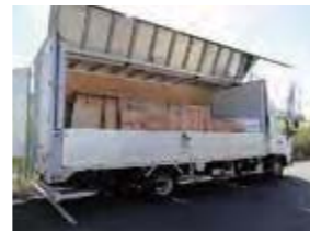
▲ 出発を待つ、メガマスザメ