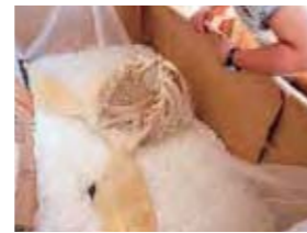
▲ 自家製の専用コンテナに収容