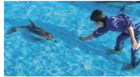
▲ 自発摂餌トレーニング②