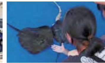
▲ サメとエイのタッチングプール