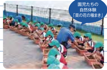
園児たちの 自然体験 「菜の花の種まき」