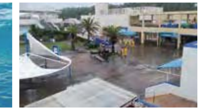
▲ 台風12号の高波被害にあった園内