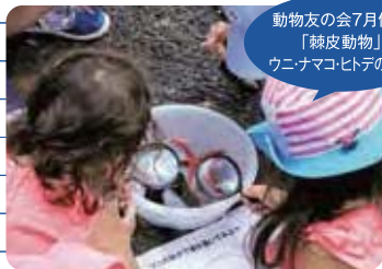
動物友の会7月例会 「棘皮動物」 ウニ・ナマコ・ヒトデの観察