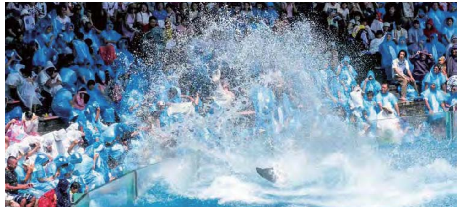
▲ 毎年恒例となったシャチの「サマースプラッシュ」