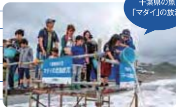
千葉県の魚 「マダイ」の放流