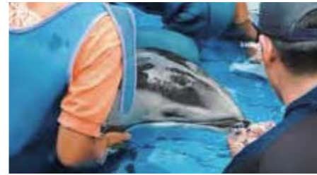
▲ 自発摂餌トレーニング①