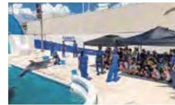
▲ 今年、46回目を迎えた「サマースクール」