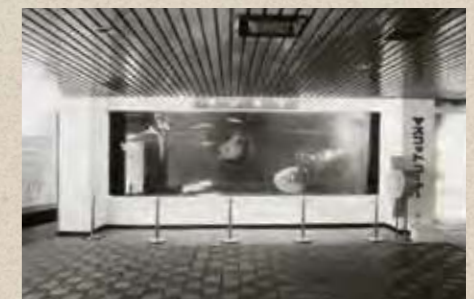
▲ オープン当初のマンボウ水そう