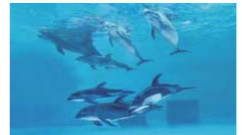
▲ バンドウイルカとの同居