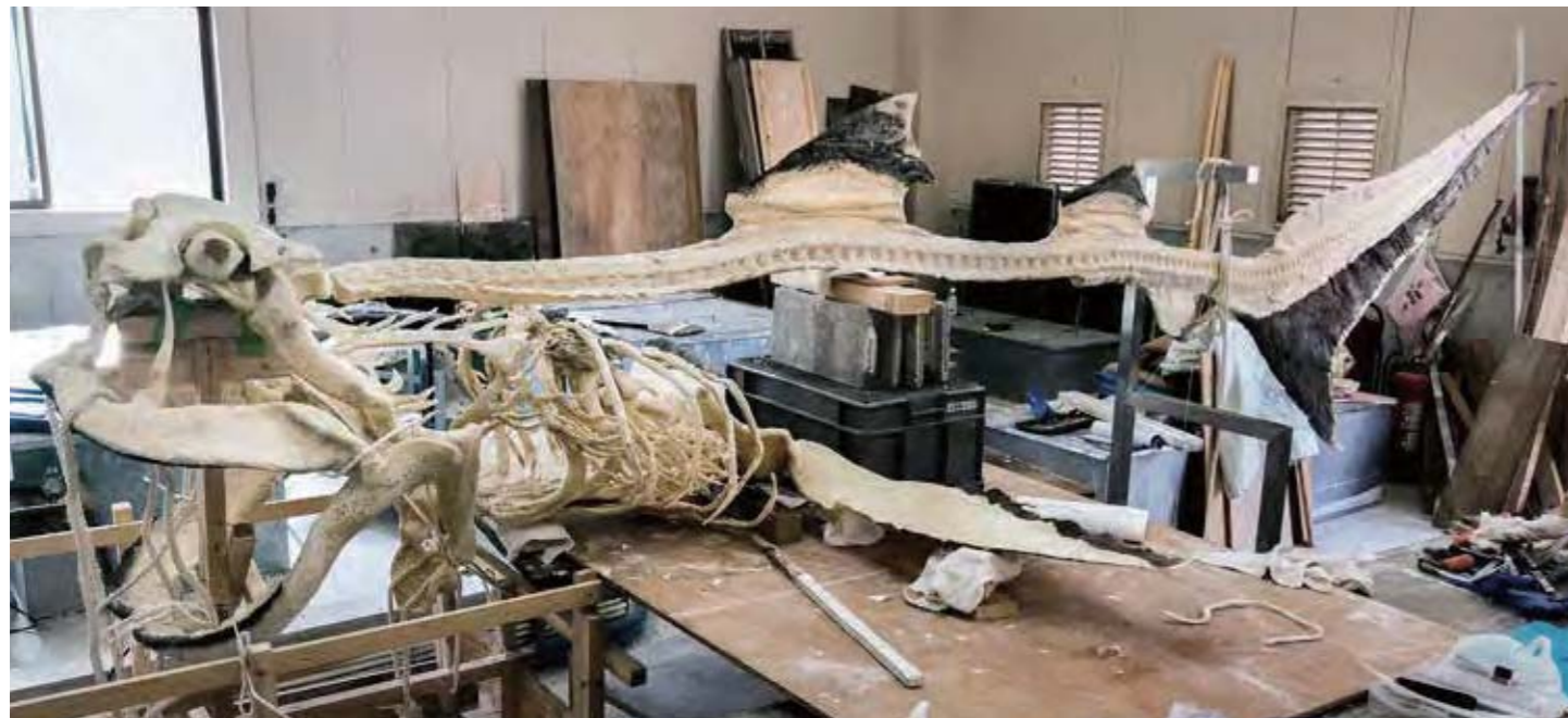
▲ 完成間近の全身骨格標本