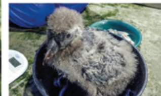
▲ 換羽中のヒナ(30日齢)