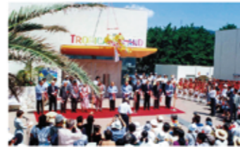
▲ トロピカルアイランド