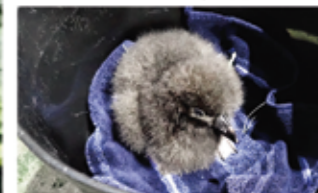
▲ ふ化間もないヒナ(3日齢)