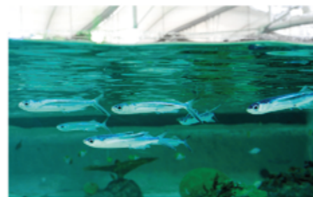
▲ ツクシトビウオの展示

やってくるツクシトビウオ、ホソトビウオなどを定置網で採集し、「トロピカル入江」水そうで飼育に挑んでいます。少しでも長く展示できるように成魚を選んで採集、飼育する一方で、人工授精で得られた子どもを飼育環境になれさせて展示していますが、まだ試行錯誤が続いています。