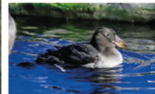
▲ 初めての遊泳、巣立ちをむかえる