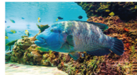
▲ 「エメラルドの入江」を泳ぐメガネモチノウオ

メガネモチノウオは、サンゴ礁に暮らす大型魚類の代表として、オープン以来「無限の海」水そうで展示してきましたが、おなじく大きな体のタマカイやマダラトビエイも展示されていて、きれいな色をしたメガネモチノウオの魅力がなかなか伝えきれていませんでした。そこで太陽光が水そう全体にとどく「エメラルドの入江」水そうに移動することにしました。暴れて傷つかないように最善の注意をはらって作業した苦勞をよそに、しばらくの間は岩陰に隠れて姿をあらわしてくれませんでした。新しい環境になれると、「無限の海」水そうで一か所にじっとしていた姿とは変わって、サンゴの間を偵察する様に自由に泳ぐ姿を見せてくれるようになりました。