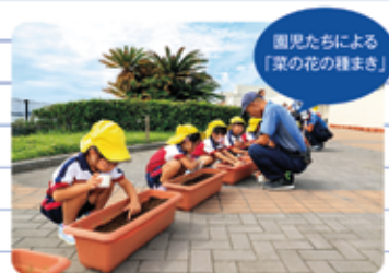
園児たちによる 「葉の花の種まき」