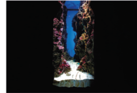
▲ チンアナゴの展示水そう

当館でも改修にあわせて円柱水そうの1つで展示を開始しました。人影を気にして砂に潜ってしまうため、明るい場所に設置している円柱水そうではマジックミラーフィルムを貼り、チンアナゴの側からは外のお客が見えないよう展示に細工が必要でした。現在展示している「洞窟(どうくつ)」水そうは、観覧面より水そう内が明るいので、フィルムを貼ることなくチンアナゴの行動を観察していただいています。