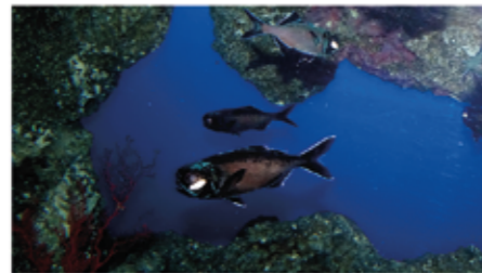
▲ ヒカリキンメダイの展示水そう

をしています、この魚のシルエットを目立たせるために、水そうの手前よりも奥を明るくし、さらに自動でエサをあたえられる装置を設置して、観覧面に近い暗い場所に誘導しながらご覧いただけるようにしています。