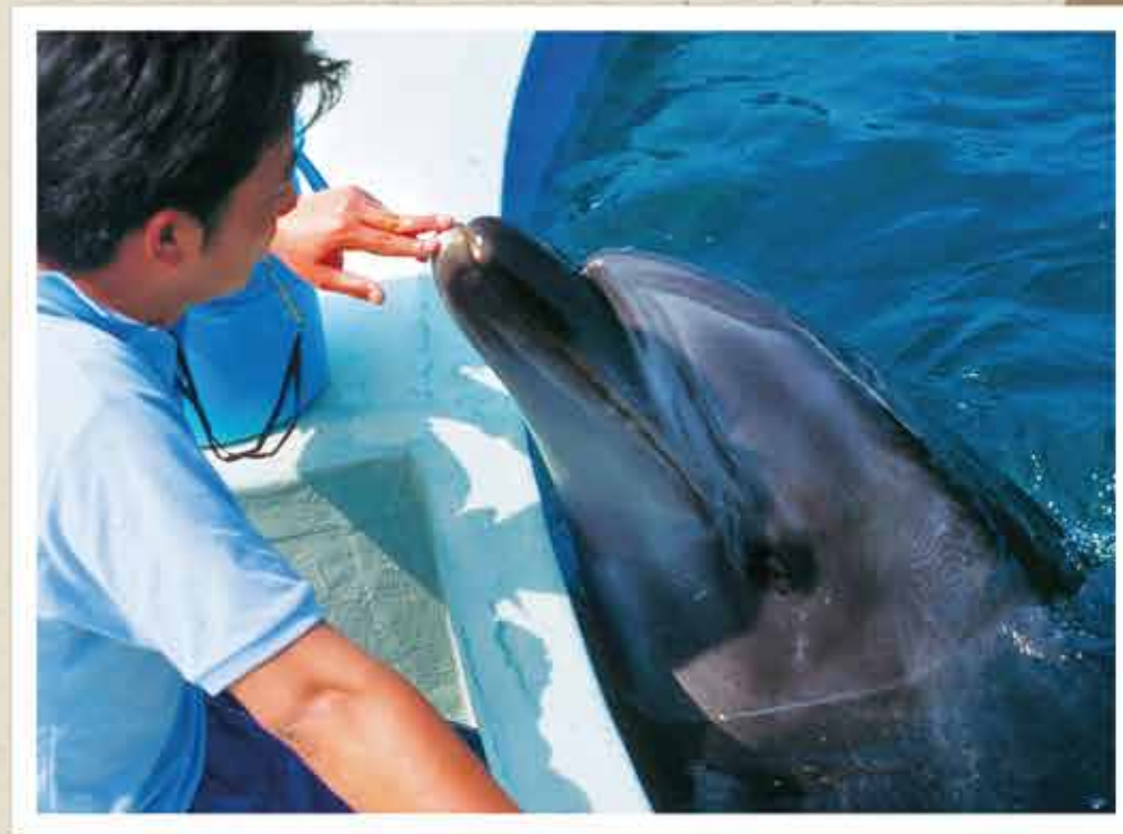
▲バンドウイルカの「ウルフ」

イルカの人工授精は、オスから採取した精子をメスの子宮に注入することで妊娠させるものです。鴨川シーワールドでは長年イルカの人工授精に取り組み、これまでバンドウイルカとカマイルカで人工授精による繁殖に成功しています。この人工授精に不可欠な精液の採取を、トレーニングによりできるようになった初めてのバンドウイルカが「ウルフ」です。