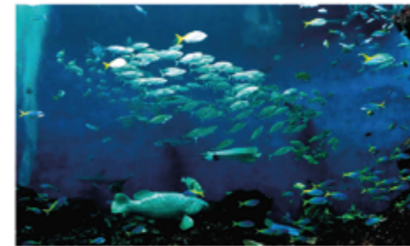
▲ 「無限の海」で群れるグルクマ

「無限の海」水そうで魚を群れで見せるための工夫です。オープン当初はタカサゴの仲間であるクマザサハナムロやウメイロモドキで群れの展示を試みました。最初のうちは群れていたものの、自分たちの身が安全だと分かるとばらばらになってしまい、思ったような群れをつくりませんでした。そこで、タカサゴの仲間よりも群れをつくるサバの仲間、グルクマで群の展示に挑戦することにしました。グルクマは採集や輸送が難しいことが知られていたため、大型の活魚車を使って20尾くらいの少なめの数で試験輸送をおこないました。その結果、水温などに影響を及ぼす輸送時期に注意すれば生かして運ぶことが分かりました。今ではいちどに100尾以上を運べるようになり、より大きな群れを安定して見せることができるようになっています。