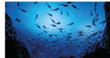
▲ キンメドキの展示水そう

「幻想の岩場」には頭上にせり出すように配置された水そうがあり、下から生物を見上げるようになっていますが、水そう上部の照明や施設までも見えてしまうため、青い天幕を背景にしています。この水そうには、オープン時よりクラゲの仲間を展示していましたが、エコアクアロームの「クラゲライフ」オープンにともない、クラゲに変わる生物を展示することにしました。ミノカサゴを展示したこともありましたが、最終的にキンメドキに決定しました。キンメドキはそれまでも色々な水そうに展示しましたが、他の魚に食べられてしまったり、同居する他の魚より目立たなかつたりしたため、単独で展示できる水そうを探していたところでした。実際に展示してみると水そう内で一か所に留まることなく前後左右に移動し、空のように見える青い背景と、水面に作り出した波が重なって幻想的な景色になり、お客様からは好評をいただいています。