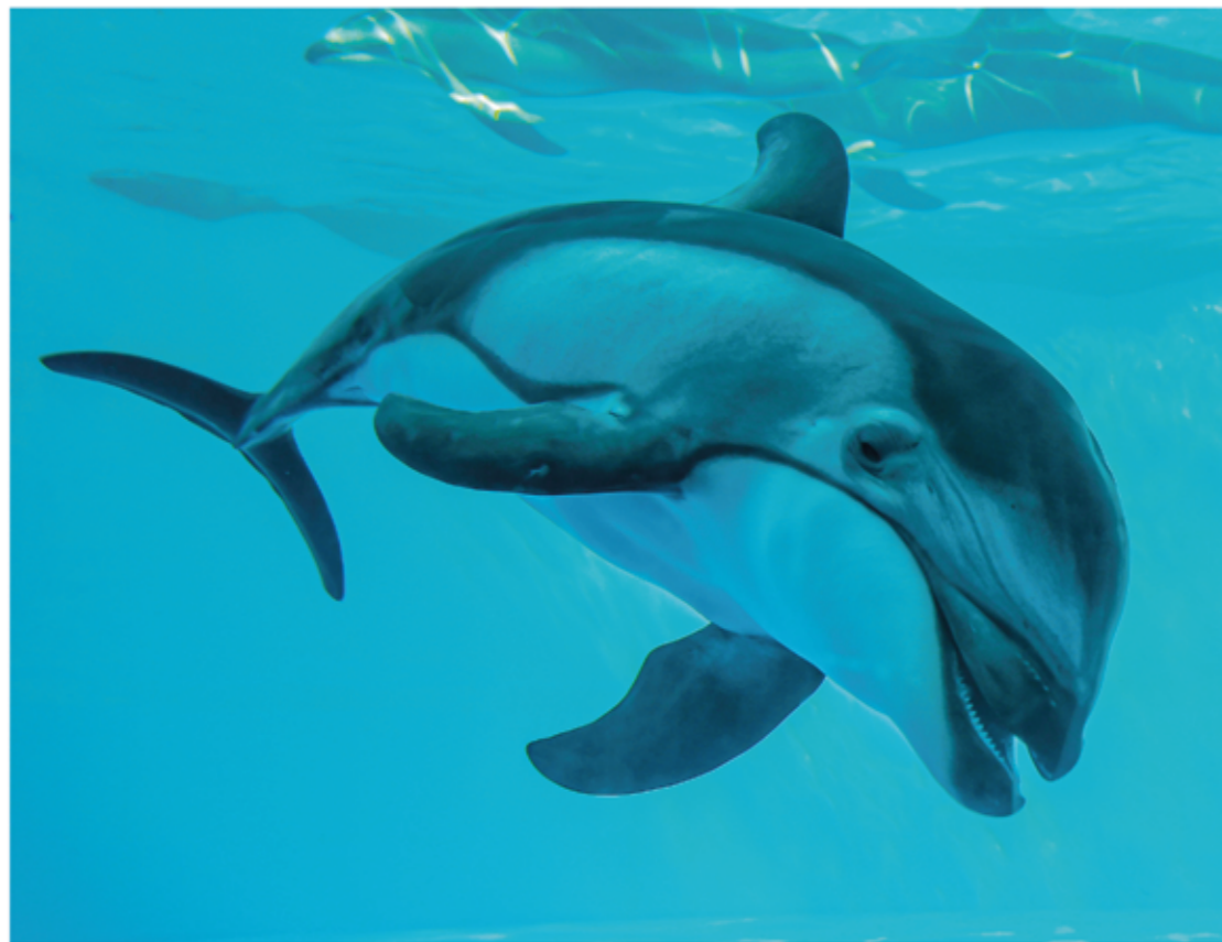
▲ カマイルカの「ディオ」