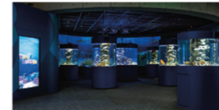
▲ 「サンゴ礁の願い Coral Message」

る魚、卵がふ化するまでお腹に付けたり口の中で守る魚などがいます。水そうの中で稚魚がふ化しても、親から離れてしまうと他の魚に食べられてしまったり、エサがいきわたらずに死んでしまいます。そこで、水そうで産卵があると飼育係はふ化する前やふ化直後に育成用の専用水そうに移して世話をします。専用水そうでは水質の維持に注意し、小さな稚魚やエサが流れ出てしまわない工夫も取り入れています。そのほかにも稚魚を驚かせないように照度のこまめな調整も必要です。トロピカルアイランドではこれまで、5種類のクマノミの仲間、2種類のテンジクダイの仲間、オイランヨウジなどを繁殖させています。繁殖に成功した種は2015年にリニューアルした「サンゴ礁の願い Coral Message」で紹介しています。