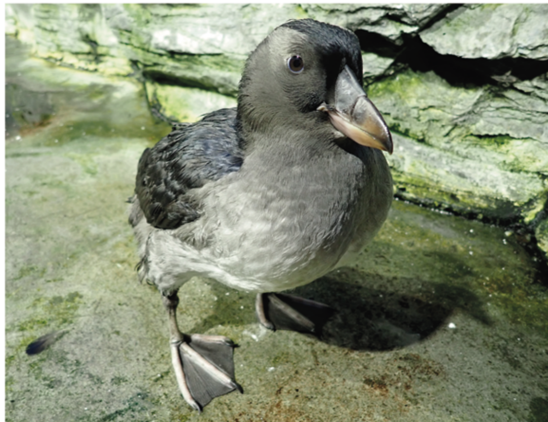
▲ エトピリカの若鳥(50日齢)