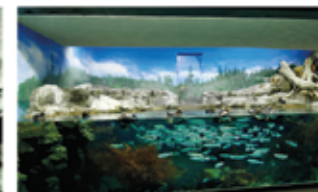
▲ 展示水そう「ピリカの森」