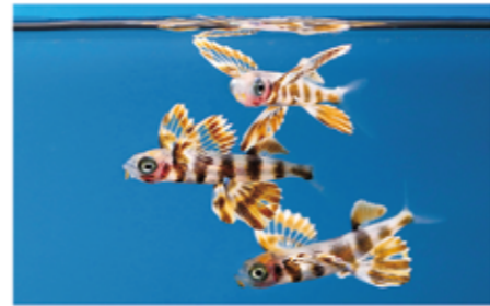
▲ 人工授精で生まれたツクシトビウオの子