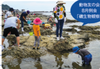
動物友の会 8月例会 「磯生物観察」