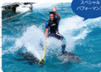
スペシャル パフォーマンス